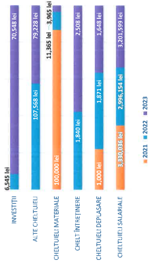
Grafic nr.2 – situația cheltuieli FPSE – 2021-2023